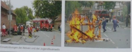
Einsatzübungen der Aktiven und der Jugendfeuerwehr

10.-12. September 2004 Fahrt nach Bad Neustadt an der Saale