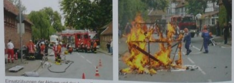
Einsatzübungen der Aktiven und der Jugendfeuerwehr